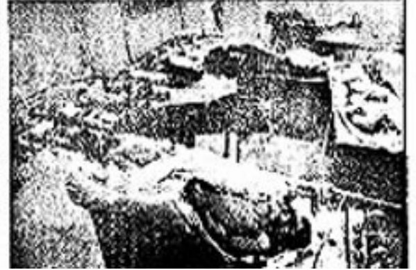
تیراندازی از تانکها در خیابانهای تهران در جریان نبرد خیابانها و تانکها

افراد مسلح هر بخوده در نبردهای مسلحانه نقش فعال دارند