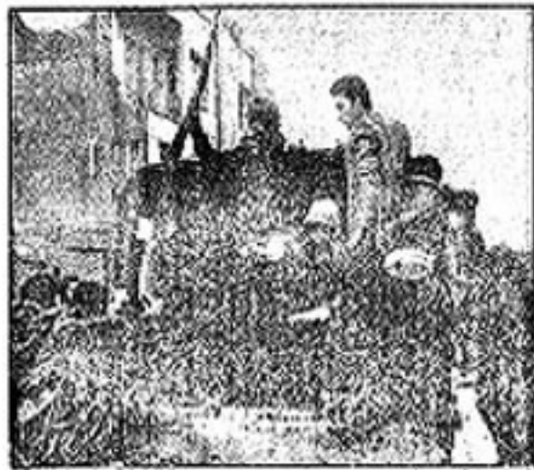
تیراندازی از تانکها در خیابانهای تهران در جریان نبرد خیابانها و تانکها

با مراجعه به منزل امام گروههای مسلح پشتیبانی خود را از امام اعلام کردند