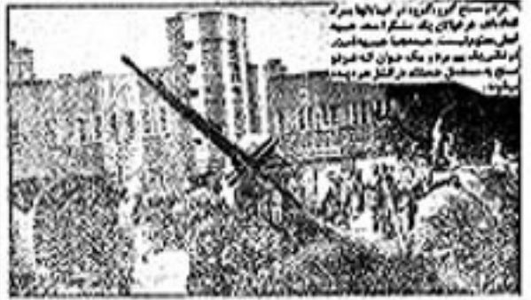
تیراندازی از تانکها در خیابانهای تهران در جریان نبرد خیابانها و تانکها