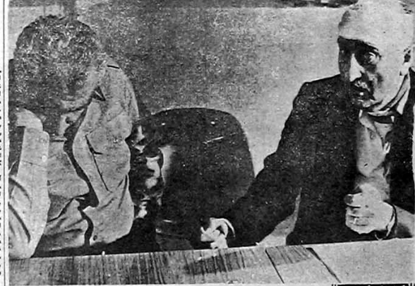
مکس غاومصاحبه با سران فراری رژیم که مردم دستگیرشان کردند

چنین سخن انداز شد ، بانها تهران است ، صدای انقلاب ، شوران مروه سر اویمه ، کرکتن امتضای رادیو و تلویزیون ملی ایران ، نام های چنین سرور امتضای خود را تکثیر و سران با پیش نام خدمت ایستگاه تلویزیون رادیو تلویزیون ملی ایران در حالیکه آمادگی لازم را داشته اند ، صدای انقلاب و سیمای انقلاب بخدمت مردم مشغول شدند سر لشکر خسرو داد ازمی محل نامعومی شد بنا به استلام رادیو از ستاد امام خمینی خسرو داد ازمی به سر لشکر و هم لشکر با اختیار بر اثر ازیق عازر امتضای مستند آن از ابتدا با هوایا به خدمت