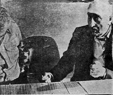
مکس غاومصاحبه با سران فراری ارزیم که مردم دستگیرشان کردند

سپهبد جعفریان سپهبد بدر های سپهبد جعفریان در روز ۲۳ بهمن ماه در جریان عملیات فدک کشته شدند. سپهبد بدر های نیز در جریان همین عملیات کشته شدند.