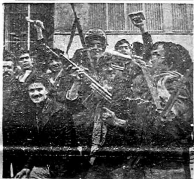
وقهر مانا نه به پیروزی رسیدند...