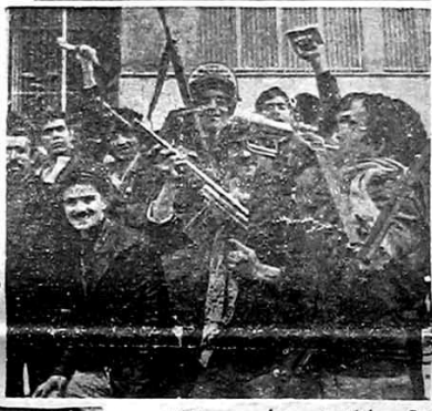
وقهر مانا نه به پیروزی رسیدند...

روز شمار انقلاب اطلاعات دوشنبه ۲۳ بهمن ماه ۱۳۵۷ شماره ۱۵۷۸۲۷