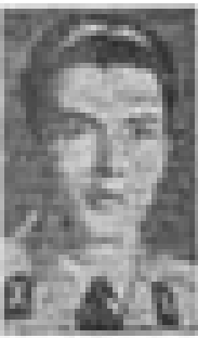
سیدمیر تقی میرزا

دکتر مصدق و ۳ تن از بارانش در غروب ۲۸ مرداد ۱۳۰۲ خودکشی کردند. این خودکشی دسته جمعی در غروب ۲۸ مرداد ۱۳۰۲، در تهران اتفاق افتاد. دکتر مصدق و ۳ تن از بارانش در غروب ۲۸ مرداد ۱۳۰۲ خودکشی کردند. این خودکشی دسته جمعی در غروب ۲۸ مرداد ۱۳۰۲، در تهران اتفاق افتاد.