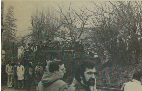
● ... سحرگاهی که امام قصد وطن داشت .... و سیل خبرنگاران منتظر در اطراف اقامتگاه امام .....