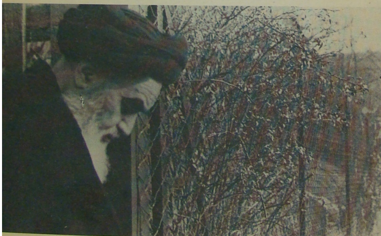
● ... امام دهکده را ترک می‌کند. متفکر و در پایان ۱۵ سال دوری از وطن که در مبارزه و پایمردی گذشت...