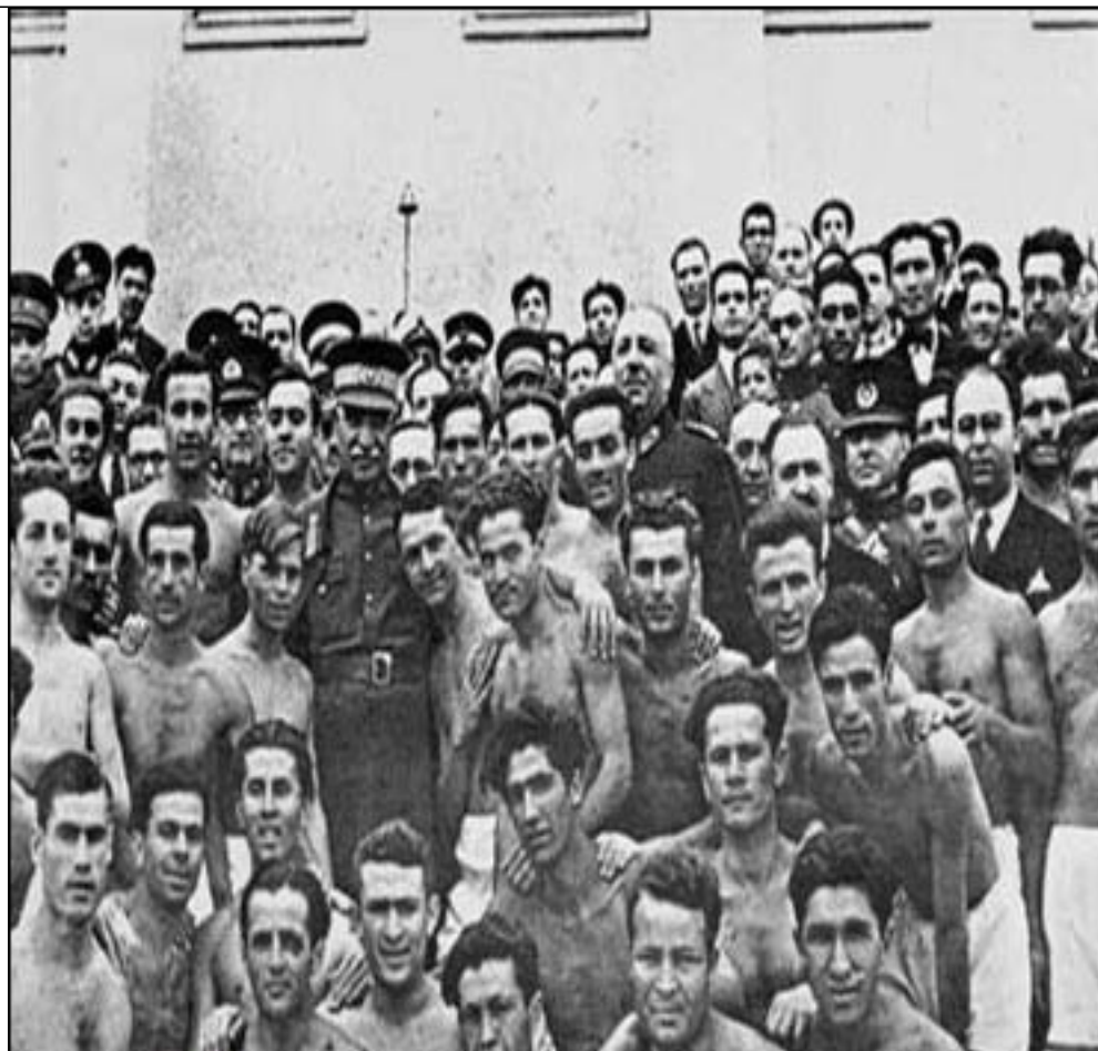
تاریخ شرح اعلیٰ حضرت رضا شاه کبیر در سفر ترقیه در میان وزیر شکاران و فوتبالیستهای ترقیه