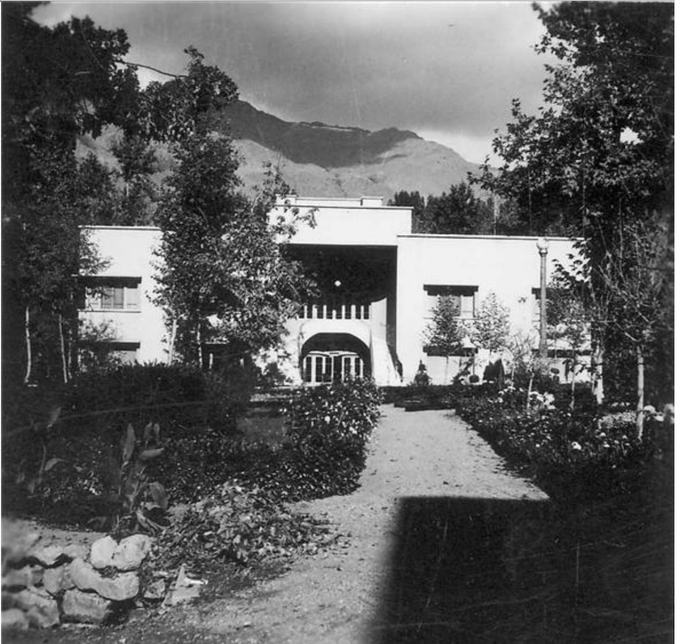
کاخ شهناز پهلوی