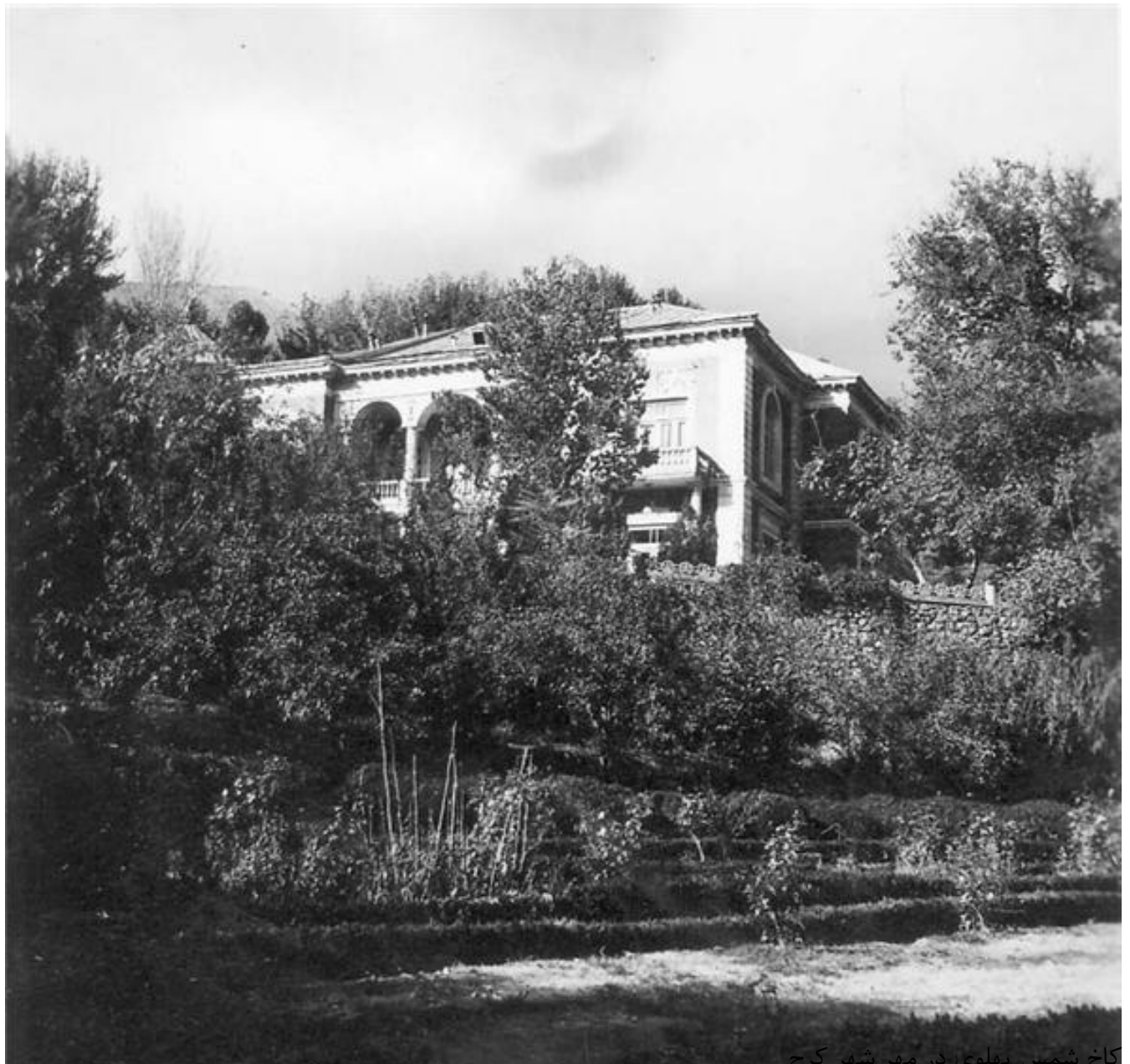
کاخ شمس پهلوی در مهر شهر کرج

هر یک از افراد خاندان پهلوی، این استعداد را داشت که به تنهایی به اندازه چندین هزار نفر خرج کند و با پول هایی که باد به دستشان می رساند، زندگی به دور از رنج مردم برای خود ترتیب دهند.