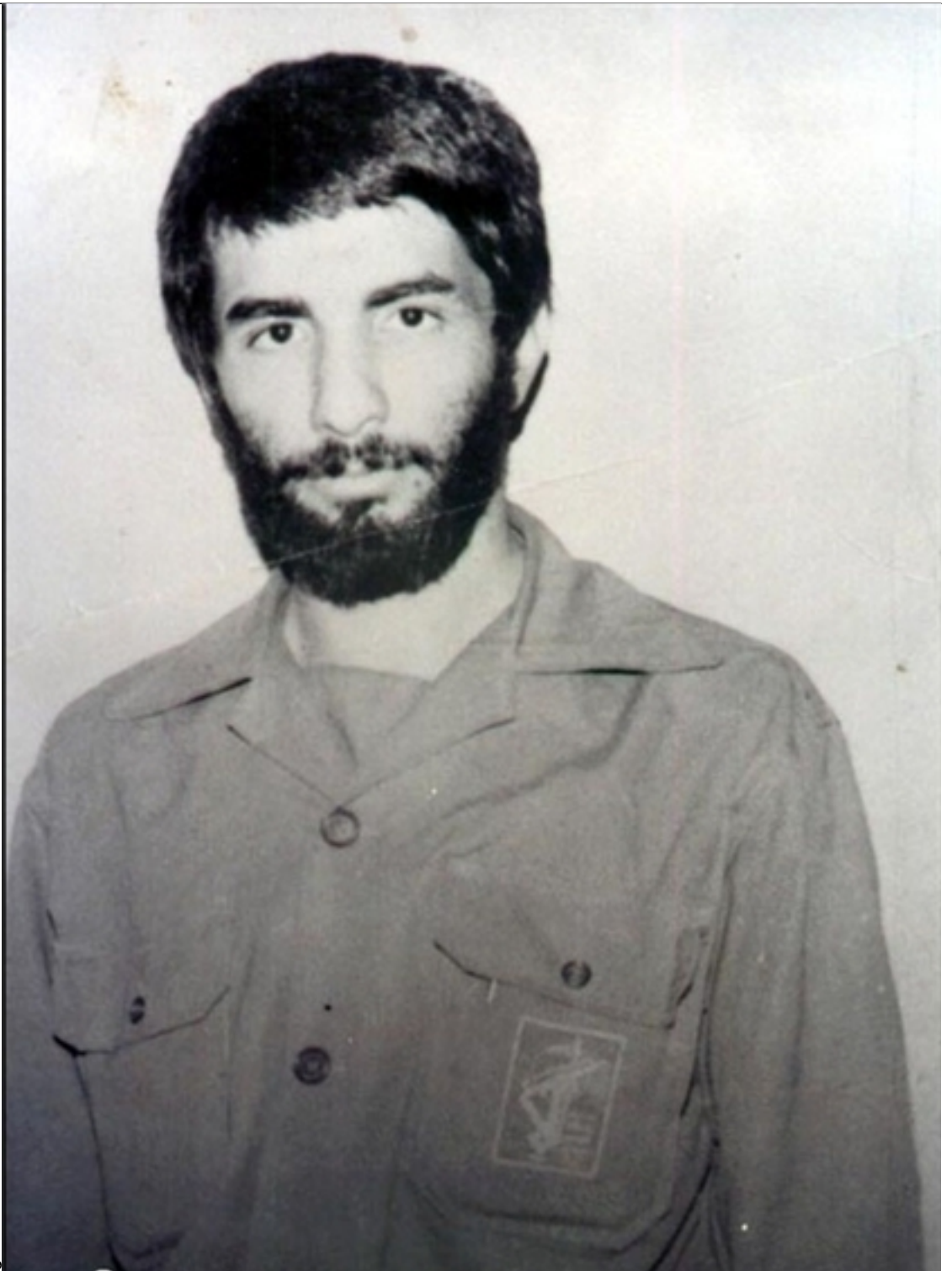
سرلشکر جهان آرا (فرمانده