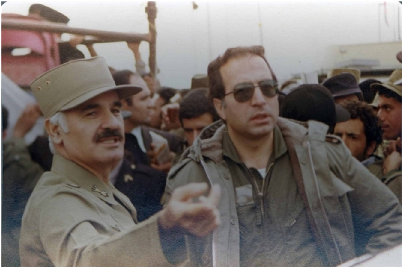
بازدید سرلشکر فکوری (مشاور جانشین رییس ستاد مشترک ارتش) (سمت راست) و سرلشکر قاسمعلی ظهیر نژاد از جبهه های جنگ