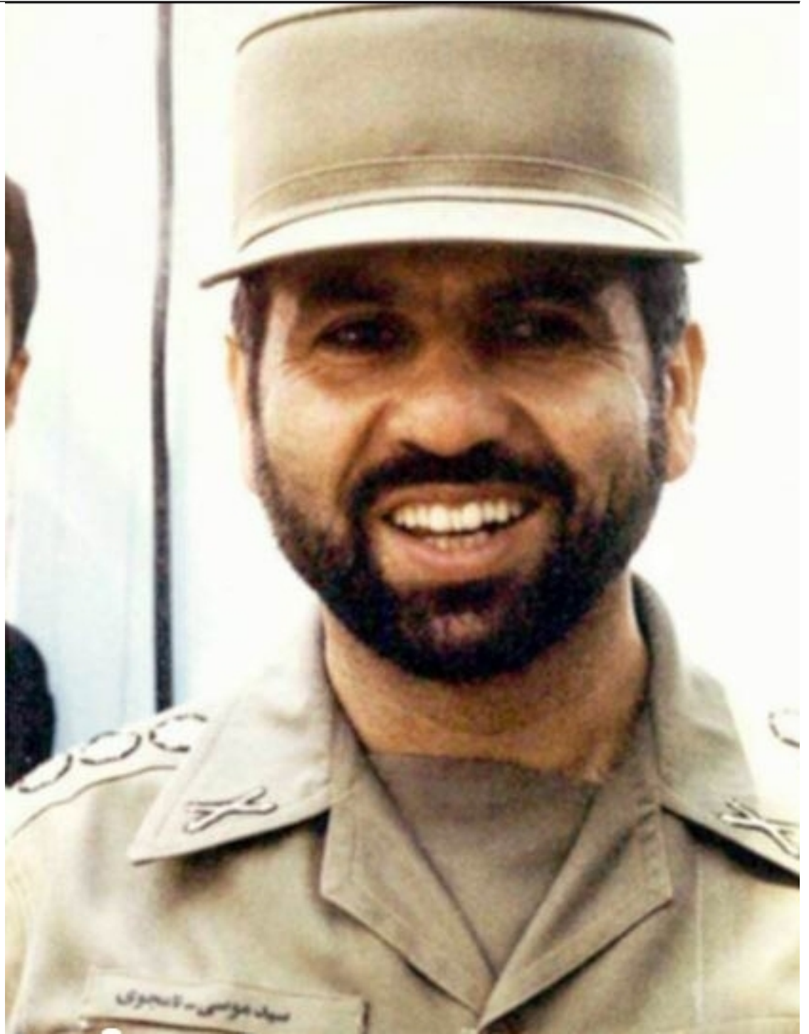
سرلشکر شهید، سید موسیٰ نامجو (وزیر دفاع)