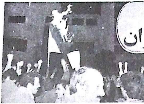
ساعت و نیمه این حرکت عظیم انقلابی که همه مردم ایران را شاد و خندان ساخت این جوانان مبارزان برای آزادی کشور ایران.