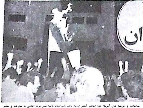
ساعت ۱۱ و نیمه شب ۱۱ آبان ماه ۱۳۵۸، دانشجویان تهرانی در خیابان ولیعصر گرد آمدند و با شعار «امپریالیسم را سرنگون کن» شعار دادند.