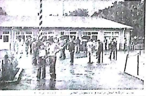
جوانان ایرانی در فرودگاه واشینگتن، ۱۱ آبان ماه ۱۳۵۸