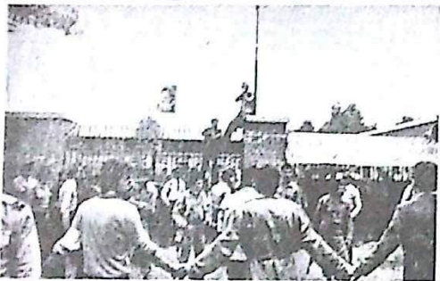
جوانان انقلابی و کادرهای مبارز در این راهپیمایی شرکت کردند و شعار دادند: «ما می‌توانیم و ما خواهیم توانست»