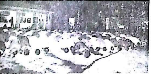
جوانان انقلابی و کادرهای مبارز در این راهپیمایی شرکت کردند و شعار دادند: «ما می‌توانیم و ما خواهیم توانست»