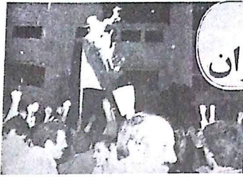
ساعت و نیمه این امریکاییان در این راهپیمایی گسترده مردمی شرکت کردند و شعار دادند: «ما می‌توانیم و ما خواهیم توانست»