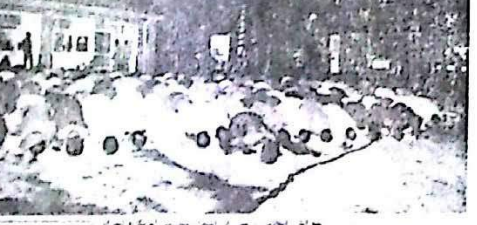
جوانان ایرانی در میدان آزادی تهران، ۱۱ آبان ماه ۱۳۵۸