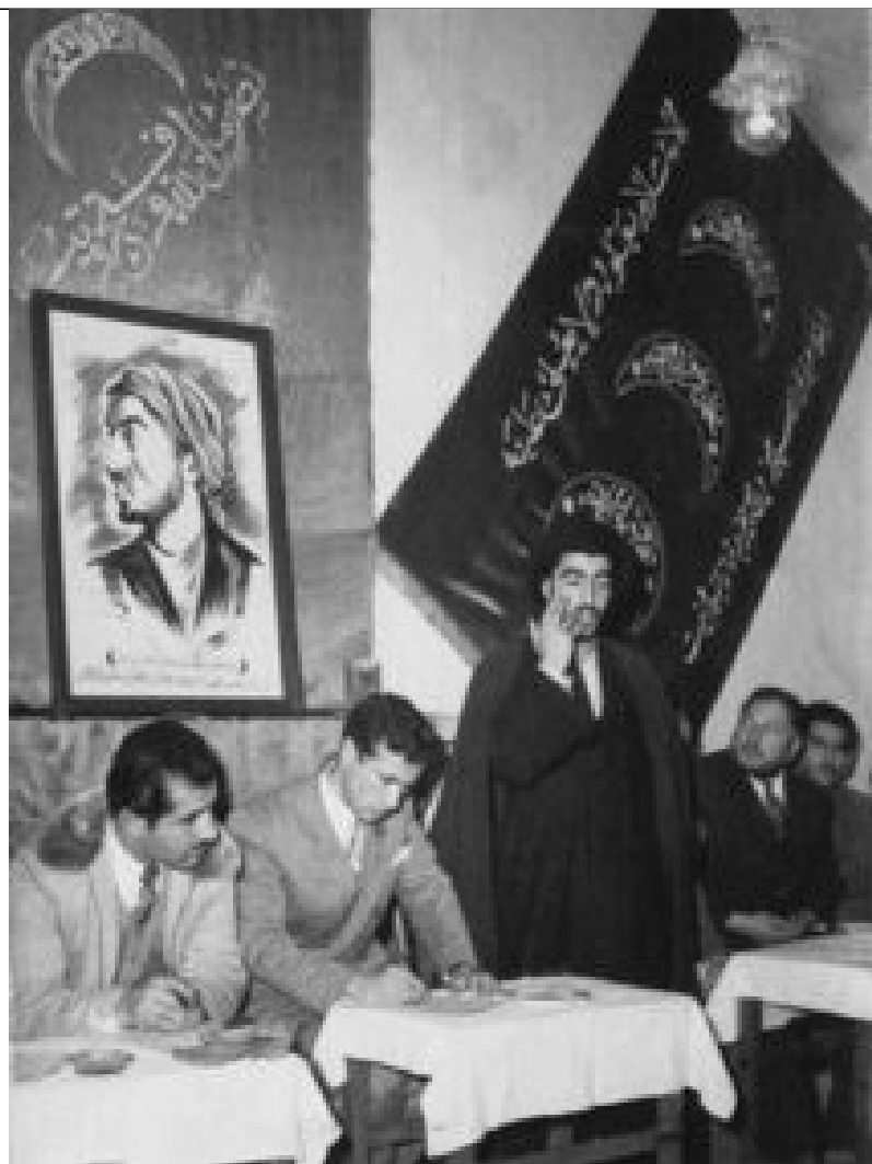
۱۳۳۱، شهید سید عبدالحسین واحدی در یک کنفرانس مطبوعاتی در دفتر نشریه «نبرد ملت»