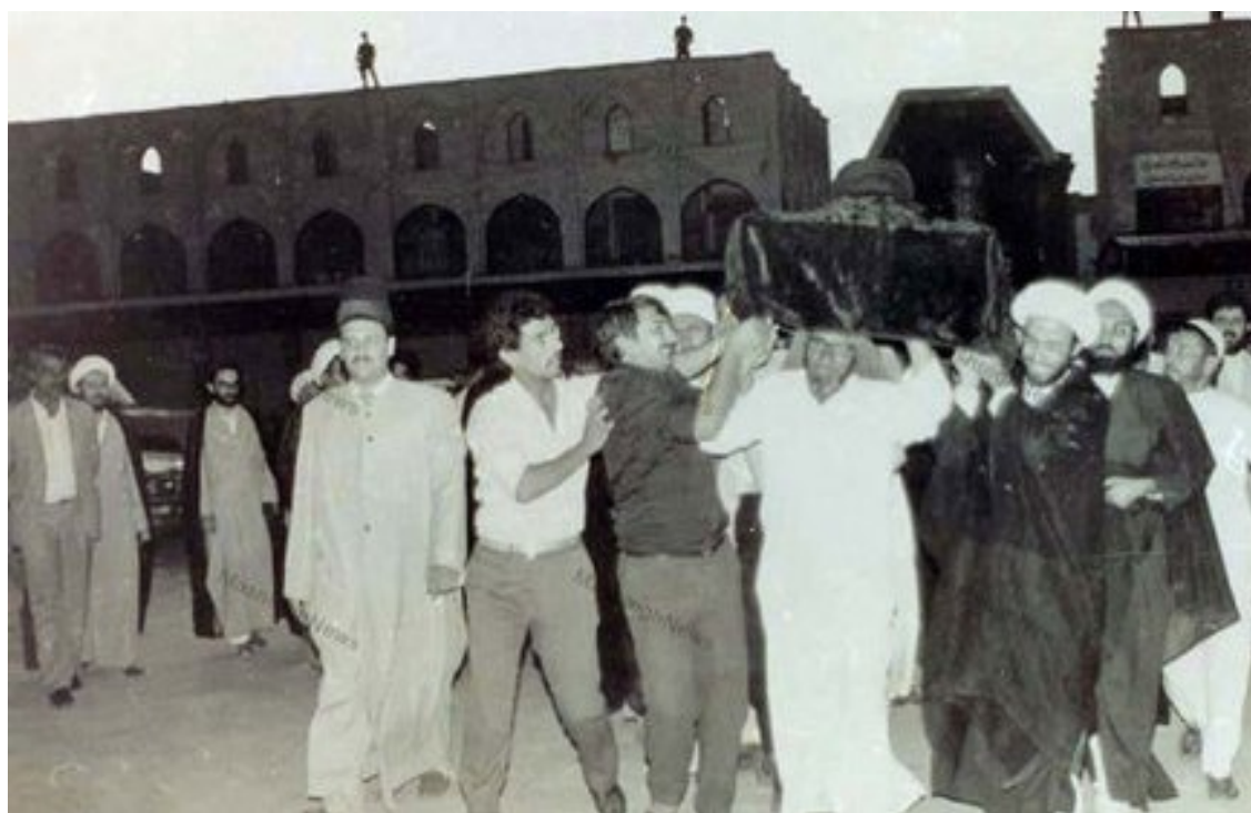
خاکسپاری غریبانه آیت الله العظمی سید ابوالقاسم خویی در مسجد خضرای نجف