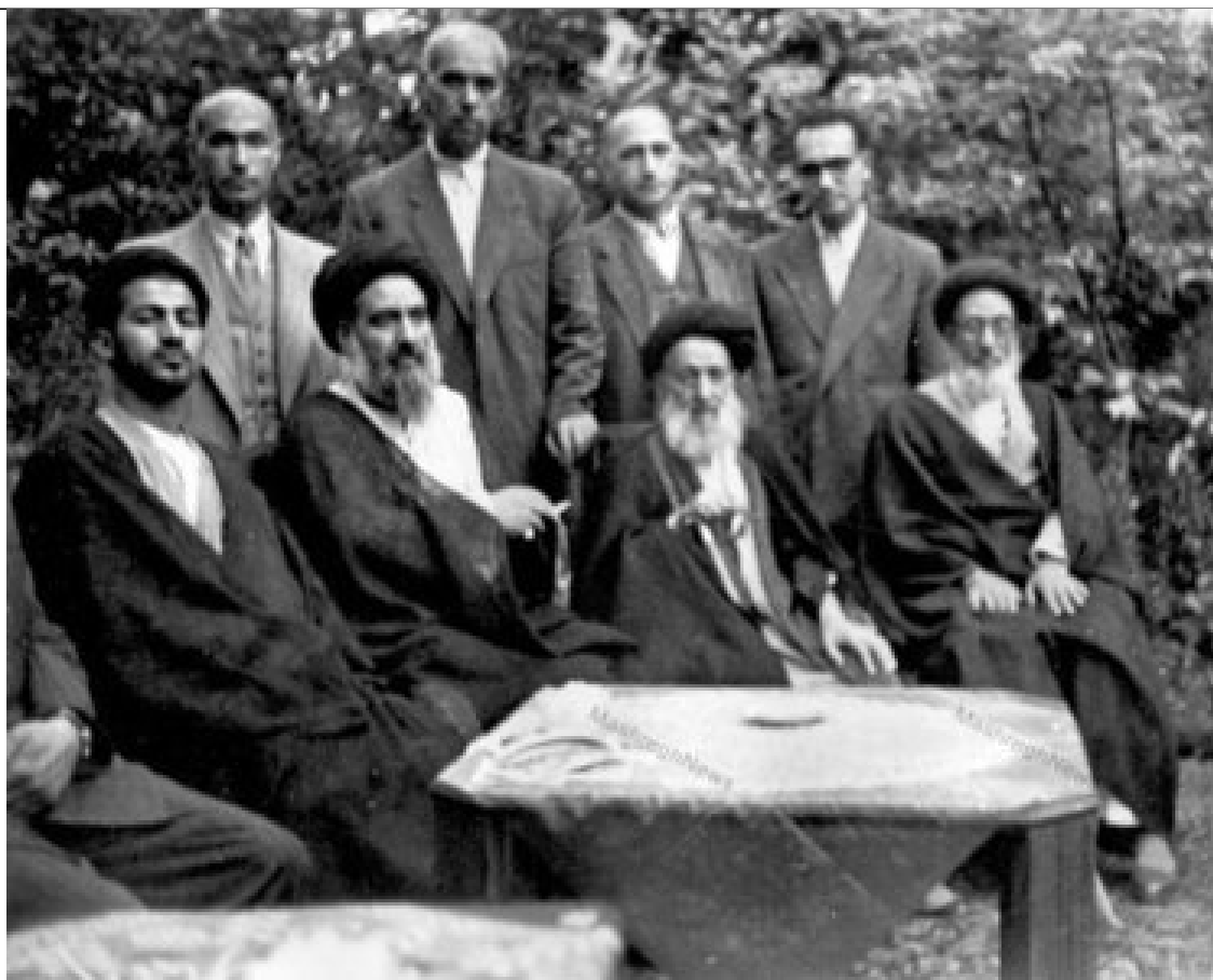
آیت الله العظمی سید ابوالقاسم خویی در سفر به ایران و در کنار پدرش حجت الاسلام سید علی اکبر خویی