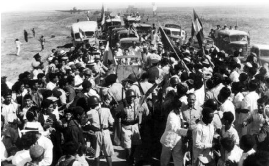
حسین مکی در روزهای مسافرت به آبادان برای خلع ید از شرکت نفت ایران و انگلیس