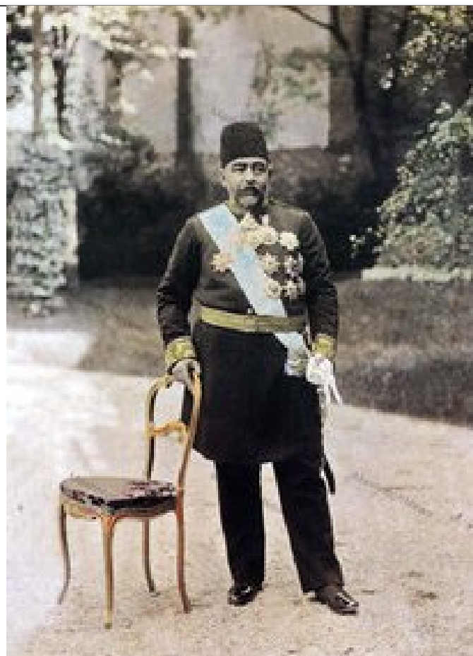
علی اصغر خان امین السلطان در دوران صدارت