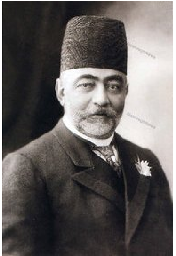
علی اصغر خان امین السلطان