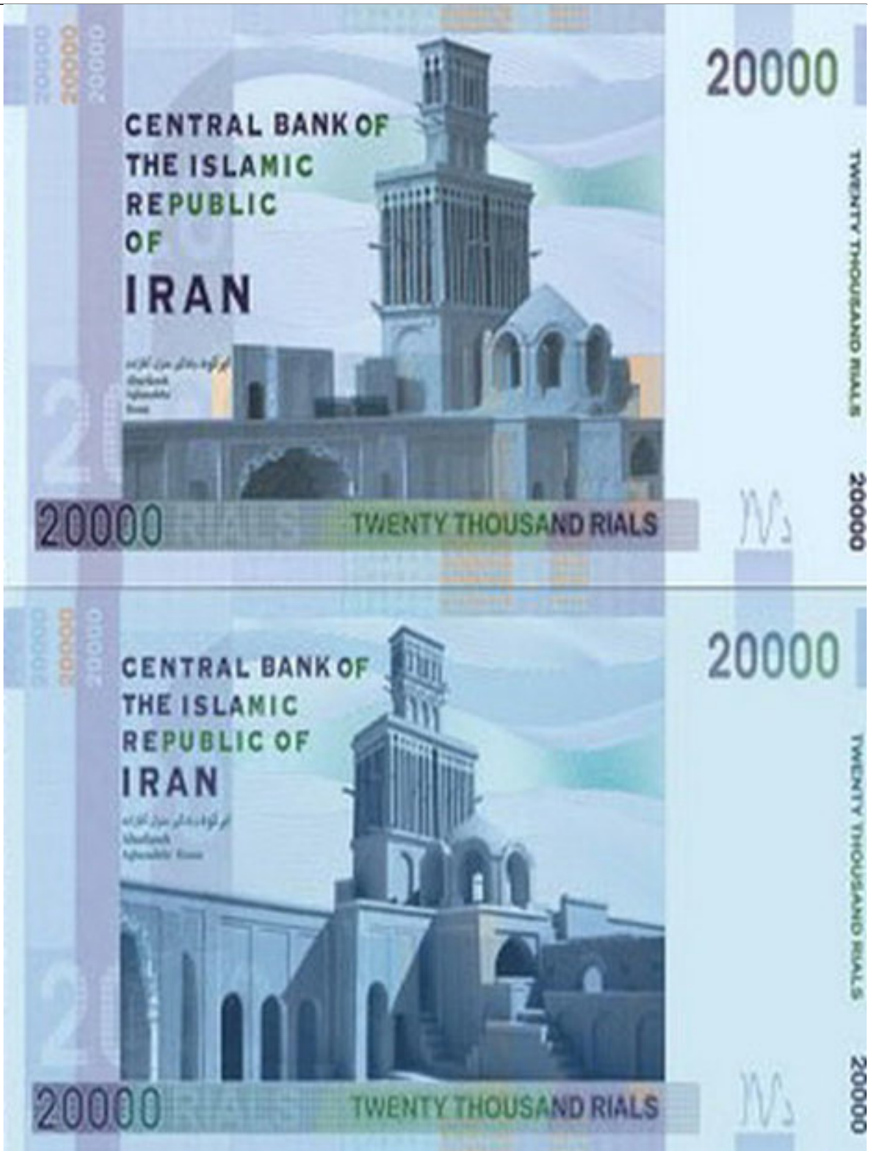
تصویر خانه آقازاده روی اسکناس