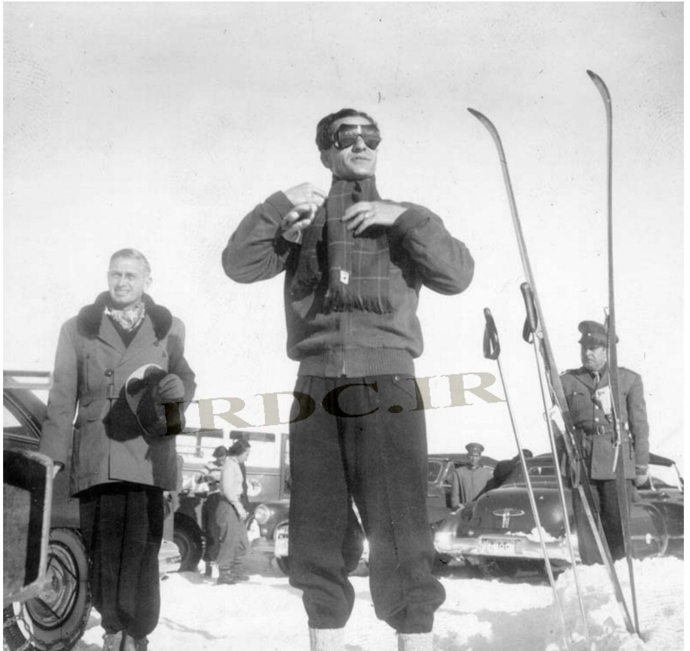
محمد رضا پهلوی به اتفاق ارنست پرون و جعفر شفقت در حال اسکی روی برف در اوایل سلطنت