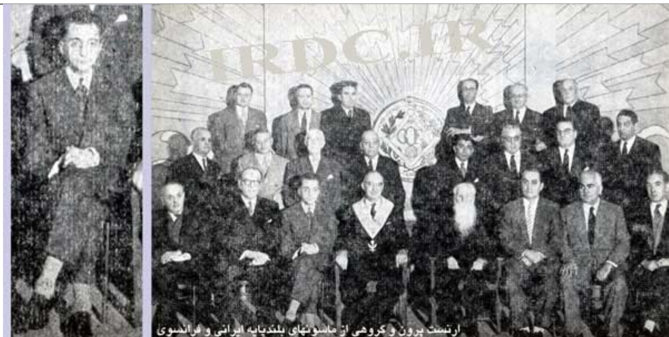
ارنست پرون و گروهی از ماسونهای بلند پایه ایرانی و فرانسوی