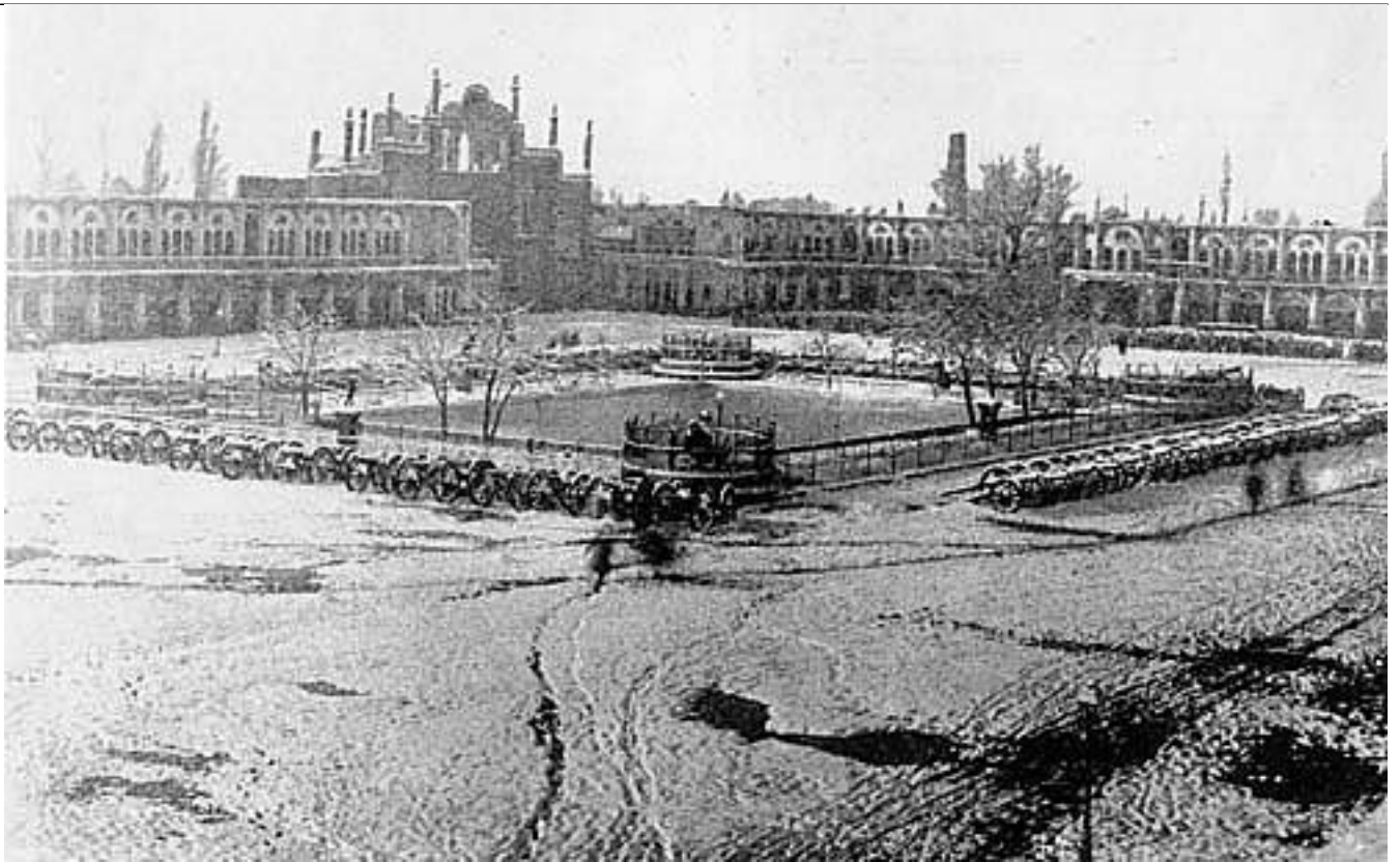
بختی جوون و نون دار، روزی بکن زجایی

تهرانی های خرافاتی قدیم، توپ مروارید را مقدس می دانستند و در روزهای خاصی مثل چهارشنبه سوری و شب ۲۷ ماه رمضان و شب های قدر به آن دخیل می بستند، خصوصاً دختران و زنان بی فرزند از زیر لوله آن دعاکنان با تنی لرزان می گذشتند با این باور که هر چه زود تر دختران بختشان باز و زنان نازا دارای فرزند می شوند و این باور اشتباه تا حدی بود که در شب چهارشنبه سوری زنان و دختران، پول، شیرینی و کله قند به نگهبانان توپ مروارید می دادند تا در اجرای مراسمشان آزاد باشند.