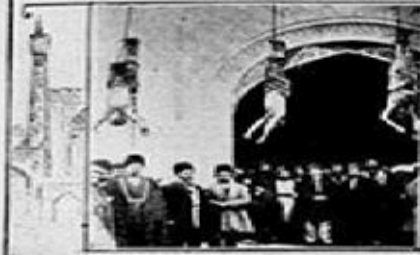
THE PERSIAN METHOD OF HANGING. According to Persian customs, several of these are hanging from the gallows at Teheran and several other cities.