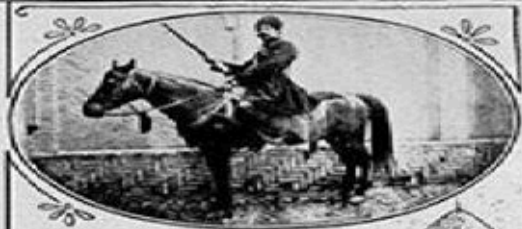
TYPE OF PERSIAN POLICE WHICH CARRIED OUT THE SHAH'S WISHES UNDER COSACK COMMANDERS.