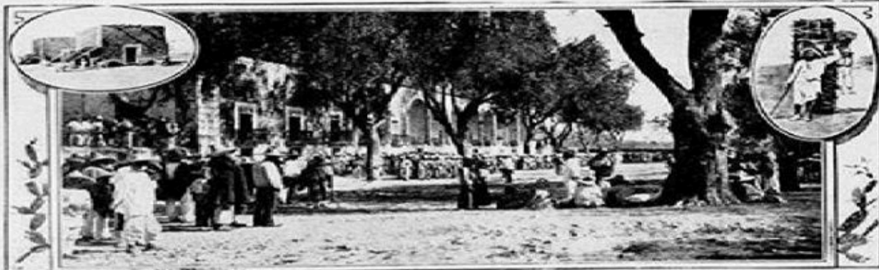
MEXICAN TROOPERS PREPARING TO TAKE THE FIELD ON THE NORTHERN FRONTIER.