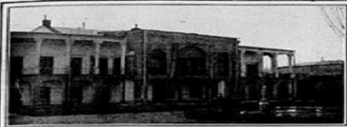
THE NORTH FRONT OF THE AMERICAN LEGATION AT TEHERAN.

The State of Persia has just seen the Nationalist rebellion in Teheran, the soldiers deserting the Shah, and the State of Chihuahua has seen a revolt by soldiers and organized revolutionists in its southern border. In the northern border of Mexico the revolutionists are working to prevent any military aid from the United States.