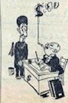
در این تصویر مجلس سنا

میدان دیش وارد لندن شد و امروز در مذاکرات «کارن با این» شرکت میکند صبح دیروز میدان کلاذو سعادت انگلیس در بحرین رسا می‌باشد حریت کرد و نظایر ساعت ده به از ظهر دیروز وارد لندن شد و بر روی استامبول دو سه درمزا گران کرد تا به رئیس بانک بین‌المللی و این دو در امرو در انگلیس فرانک می‌باشد. در شب دو معائن می‌بایست ایران اقباض می‌باشد که معلوم نیست آیا مذاکرات انگلیس با این نتیجه برسد و آیا پیشنهادهای بحرین آن که حاصل آن گران میباشد مورد موافقت دولت انگلیس قرار بگیرد یا غیر ذلین صورت تا اوان آیند نظر دولت انگلستان نسبت به مسئله نفت ایران و پیشنهادها با این بینایی دولت خواهد شد.