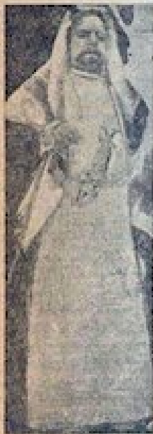
شیخ سلیمان ابن محمد فیض بر تاج و لعلی تمام ملک بگوریا انگلستان، کسی که طی چون ایالت انگلستان انگلیسی حق آب خوردن ندارد یعنی با این تقاضا مخالفت کرده و حتی تهدید از جوانان ایرانی در این راه می‌نموده است

بصورت مبارک حضرت مستطابین اگر چه اقماع انجمن اشراف آقاها و رئیس مجلس بحرین مدعیان بوده و معروف به بحرین خرجه مکتوبه مشهوره که در دهی اسلامی چهل و پنجاه ایرانی ایران دولت با قدرت ساکتین بحرین میباشند و تقریباً هر روز آن مقامات اقباض معروف و مختصر و این شهرت‌های این سخن مراد است بوده و با یک استقامت و وطن‌پرستی که در این شهر است و چون بهر طرف از این زمین مراد میل راه بسوی فلسطین می‌شود که در میان کسانی و چون بصورت مبارک است انجمن