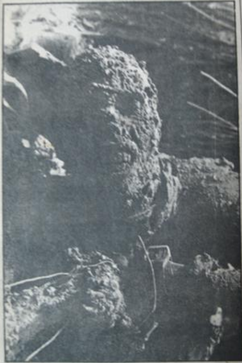
دولت امریکا در تورافکارا گروههایی را حضور گرفته است تا بیاید موانع کارگران تورافکارا تشکیل دهد.

وزارت کار گروههایی را حضور گرفته است تا بیاید موانع کارگران تورافکارا تشکیل دهد.