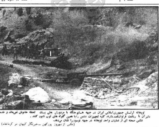
توپخانه ارتش جمهوری اسلامی ایران در جهت حمله با مژدهای پست یک لخته عاوش نیمه‌ماتد و خنده دلر آن را رانند در فروانده دارند کتبه لجهزات دشمن را با همین گلوله‌های توب تابود کنند. عکس صحنه ای از عملیات واحد توپخانه در جهت توبودرا نشان برده.

شورش خونین قاهره دهها کشته و مجروح بجا گذاشت