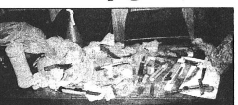
در درگیری های دیروز، جانوری مگسوزی، چاق و میجای چند له در سبست مهیجان به مردم دیده شد.

کیمیا خارآوردی می کند: زنازل هیک، وزیر خارجه آمریکا اعلام کرده بود: آمریکا در جنگ داخلی احتمالی در ایران به گروه های مسلح کمک تسلیحاتی خواهد کرد