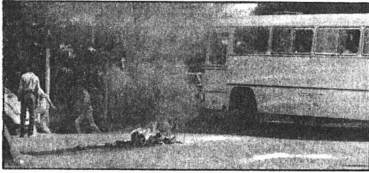
عناصر یسار آمریکایی و افراد جنس ملی مجاهدین در درگیری‌های دیروز شب به تاراج هم رجه تکراند. وسط حاشیاهای این رویداد چند وسیله نقلیه عمومی را طعمه حریق کرده و هرچه دلتان خواست کردند با آمریکا از پس این نوبت‌نوشته‌های خود را غنی کردند.

مجلسی بحث در مورد عدم کفایت سیاسی رئیس جمهوری را ادامه داد