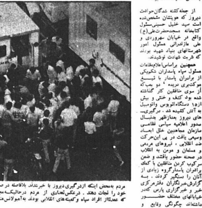
مردم میانه خیابان دیروز با حضور گسترده در راهپیمایی که عیدالله از سوی دولت اعلامی بود به مراسم تهنیت میسراند.

حادثه دیروز به شرح زیر است: ۱۶.۳۰ - خیابان ولی عصر تظاهرات گسترده در ایلیک مقامات میانه نمایان میل و سوسنی را به میخانه عرب و به آتش کشیدند. ۱۷.۳۰ - خیابان طالقانی میان فرسوس بری برآورد کننده ایروان خیابان جبهه طرفداران خود و مبارزان شیعیه میانه به آتش کشیدند.