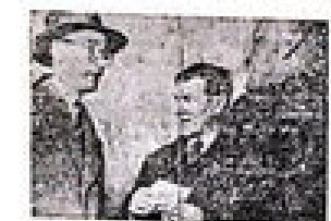
افراد در جلسه دادگاه ارتش در مورد مصدق به سال حسن مدرس.