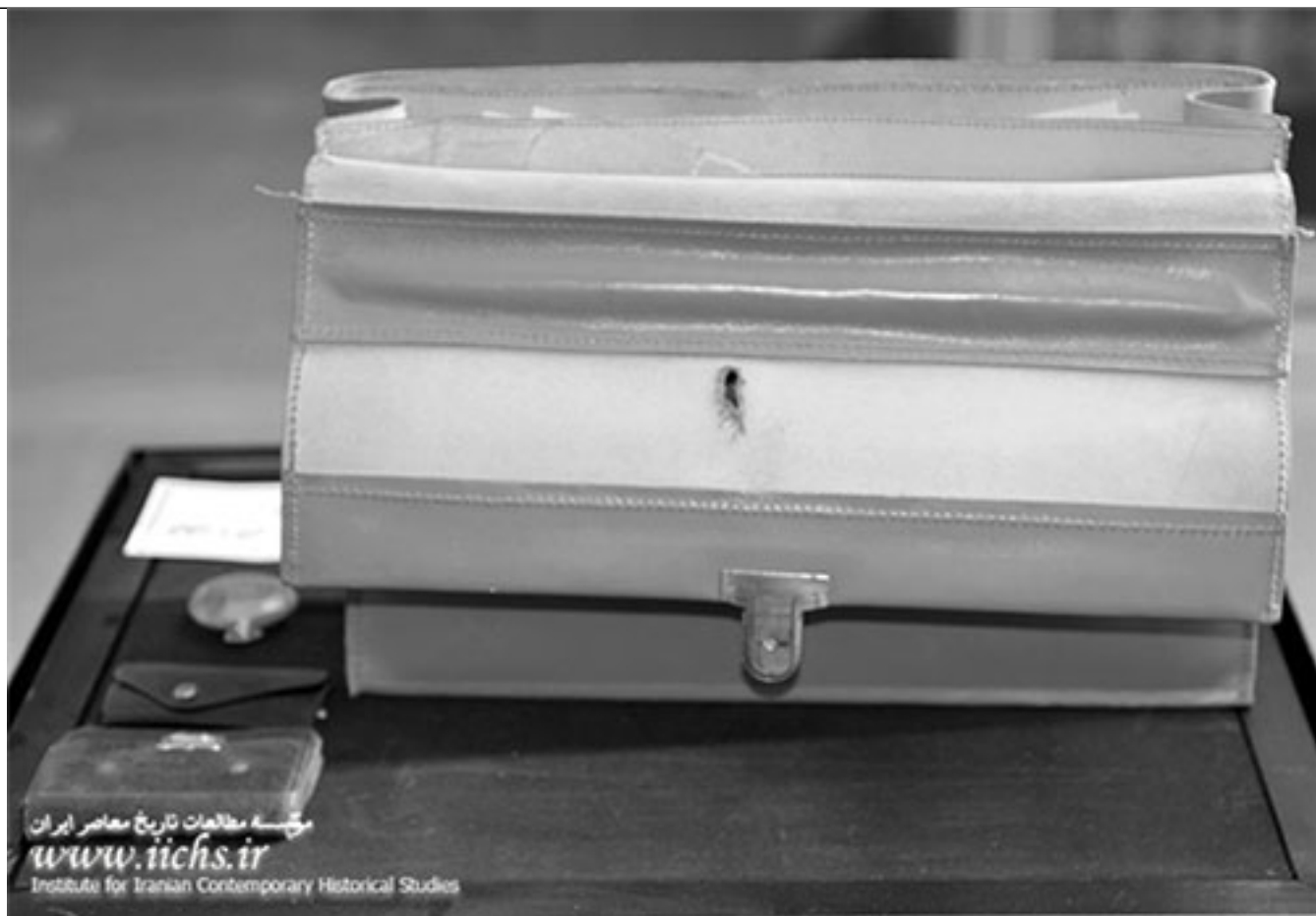
نمایی از محل اصابت تیر به بالای کیف دکتر فاطمی پس از باز شدن کیف