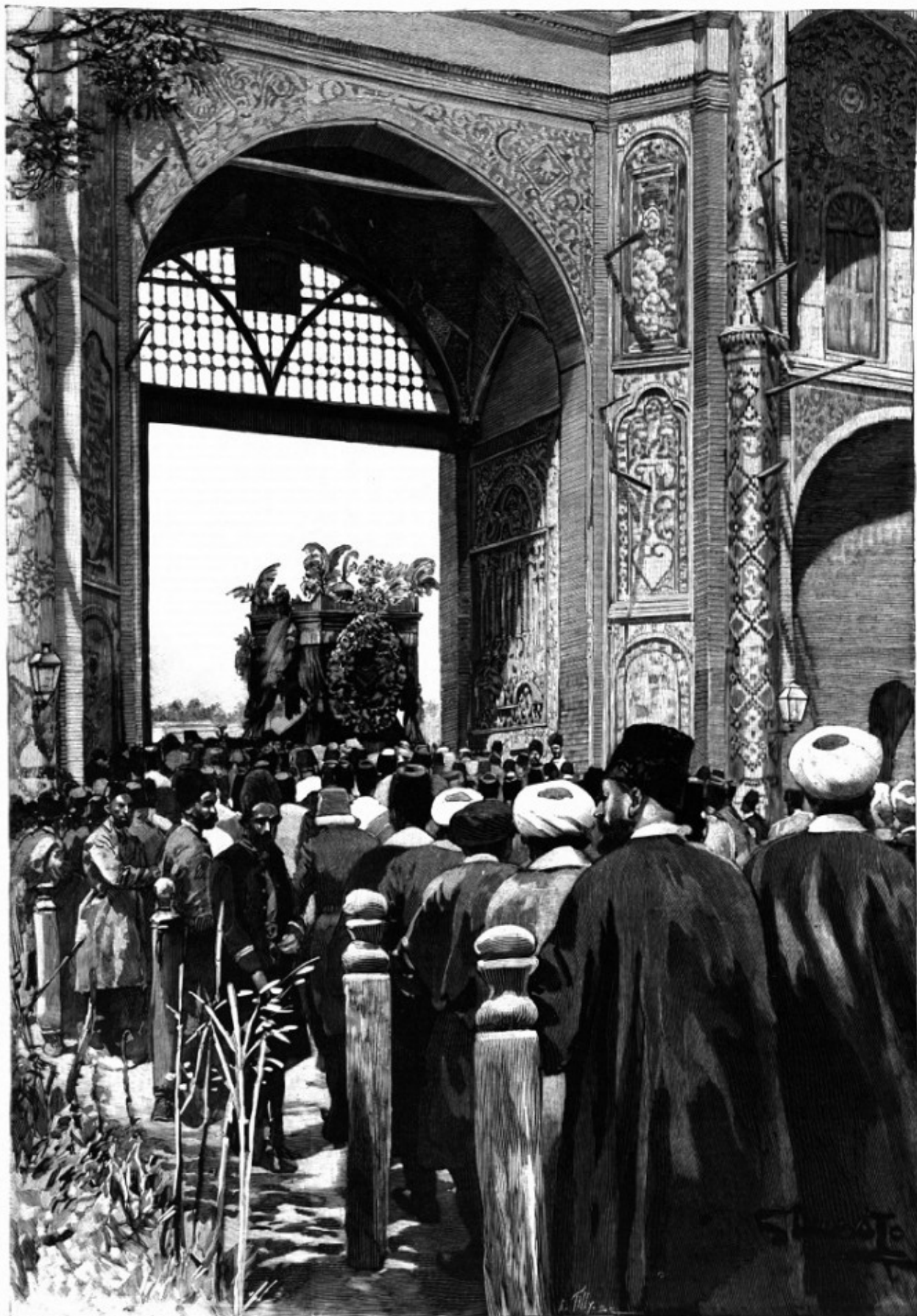
LES FUNÉRAILLES DU SHAH NASR-EDDIN, A TÉHÉRAN. — Le cortège se rendant sur la place des Canons.