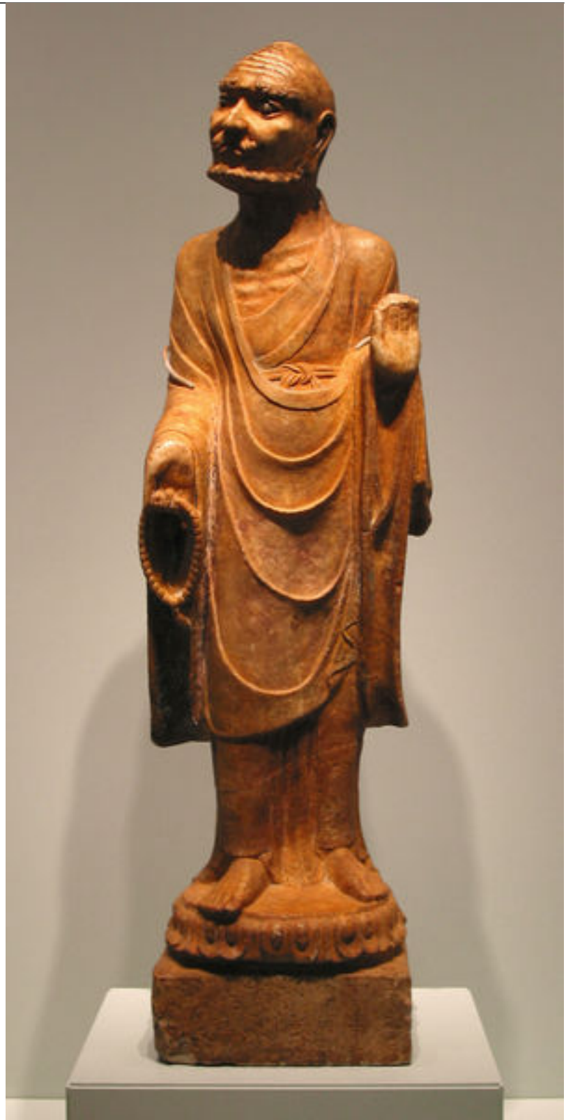
مجسمه از جنس مرمر مربوط به دودمان جین

جورچن ها در تاریخ چین اهمیت زیادی دارند. این مردمان توانستند علاوه بر دودمان جین ، در قرن ۱۷ میلادی ، دودمان چینگ را نیز در این کشور به وجود آورند.