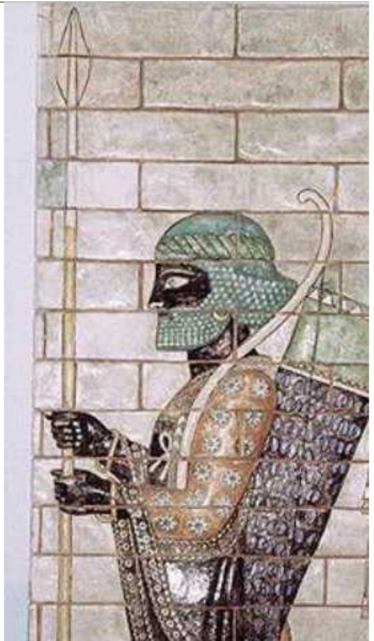
تصویر نقاشی های کاخ شوش آپادانا از دوره داریوش اول