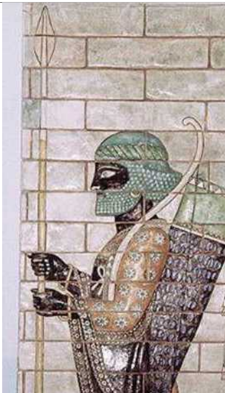
تصویر نقاشی های کاخ شوش آپادانا از دوره داریوش اول