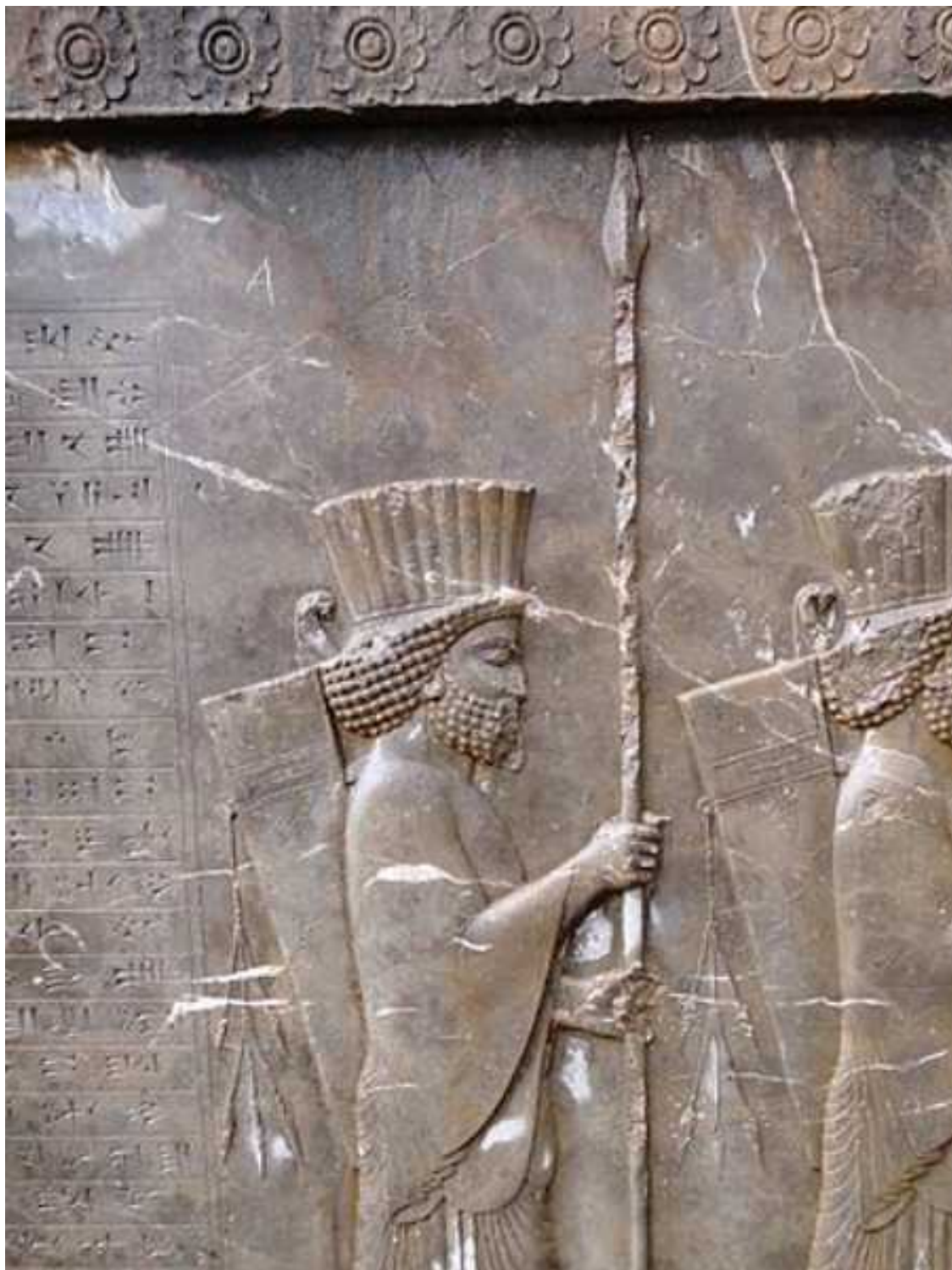
سنگ نگاره سربازان هخامنشی بر دیواره کاخ تچر

آن رسته را «پیدادگان سنگین اسلحه» می خواندند و سلاح اصلی ایشان عبارت از یک نیزه بلند، یک شمشیر یا تبرزین بود که با دست راست به کار می بردند و یک سپر کوچک که از ترکیبی محکم بافته شده بود و در دست چپ می گرفتند و به سینه خود هم